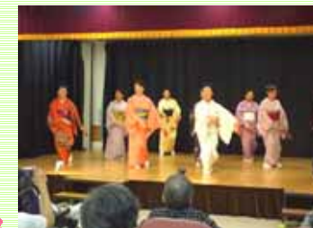
全会員による「よさこい鳴子踊り」