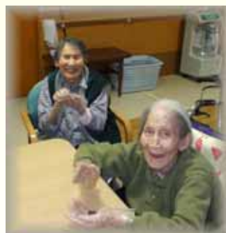
チーズや栗を入れて丸める

給食委員会主催の おやつ作りを開催 各階フロアにみな な集まり焼きあんこ 作りを行いました。 利用者の皆様も職員 と一緒にあんこを丸 めたりされました。 中にはつまみ食いを される方もおられる 等、どのフロアも 笑い声でいっぱい でした。不思議にも 出来上がると、 各階の材料や作り 方などは一緒なのに、 いろいろな形の物が できあがり、とても 賑やかなおやつ作り 行事となりました。