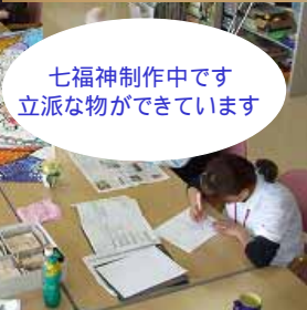
七福神制作中です 立派な物ができています