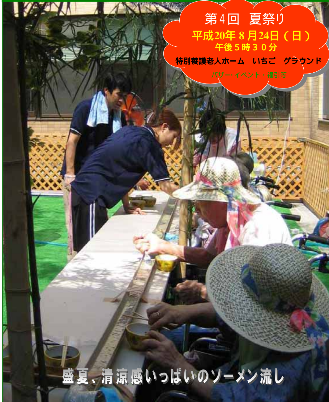
盛夏、清涼感いっぱいのソーメン流し

第4回 夏祭り 平成20年 8月24日(日) 午後5時30分 特別養護老人ホーム いちご グラウンド バザー・イベント・福引等