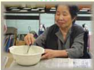
皮の材料を混ぜ合わせる