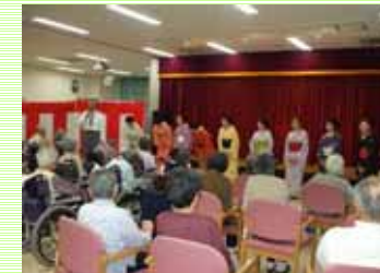
施設長歓迎の挨拶と来訪者の皆様