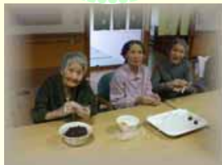
好みの形に丸める