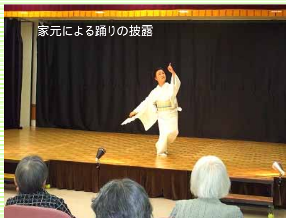
家元による踊りの披露