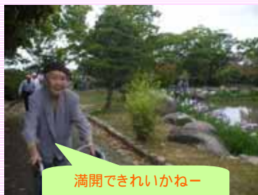
満開できれいかなー