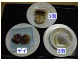
出来上がった各階の焼きあんこ