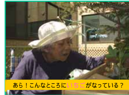
あら！こんなところにいちごがなっている？

天気も良く、久しぶりに中庭にて、皆様と一緒に「いちご」のおやつを頂きました。利用者様と職員との会話も弾み、また、笑顔も多く見られ、楽しいひとときでした。