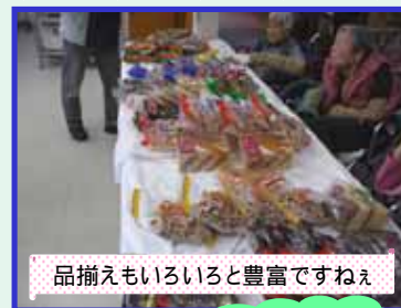
品揃えもいろいろと豊富ですねえ