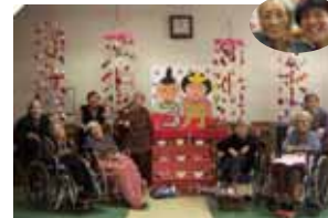
ひなたぼっこひなまつり