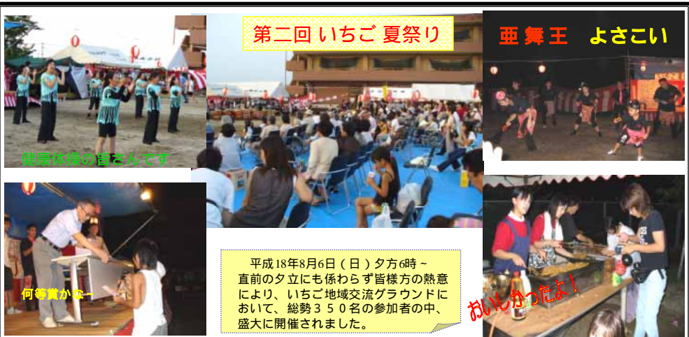
第二回いちご夏祭り

福岡県三潴郡大木町大字大角1133-1 Tel0944-33-0015 Fax0944-33-0020